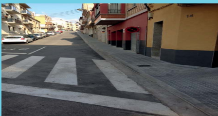
Voreres noves als c/Secretari Bonet i Sant Víctor