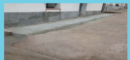
Arrenjament d'aigua potable al Barri del Guix