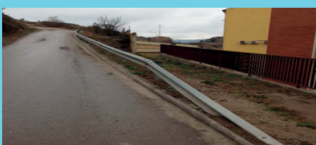
Arrenjament de la vorada del Camí del Pal