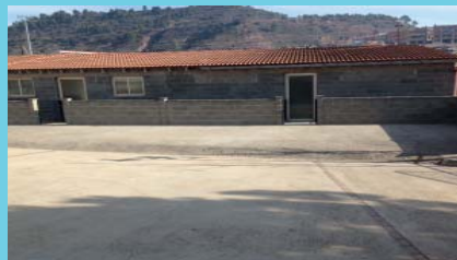
Millora del mur dels vestuaris del camp de futbol