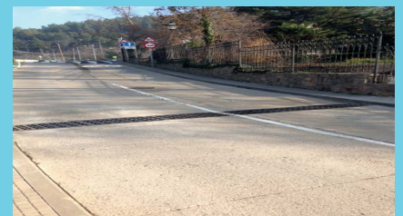
Creació d'embornals al c/Palau